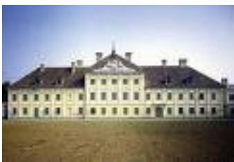
Stadtmuseum Schloss Eltz Vukovar (Kroatien)