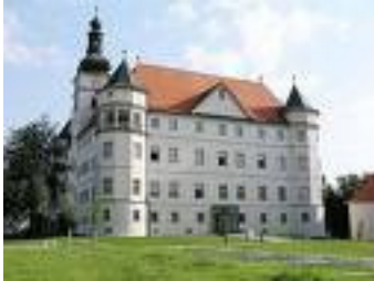
Schloss Hartheim (?) (Oberösterreich)