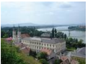
Budapest(?) , oder Esztergom (?) (Ungarn )